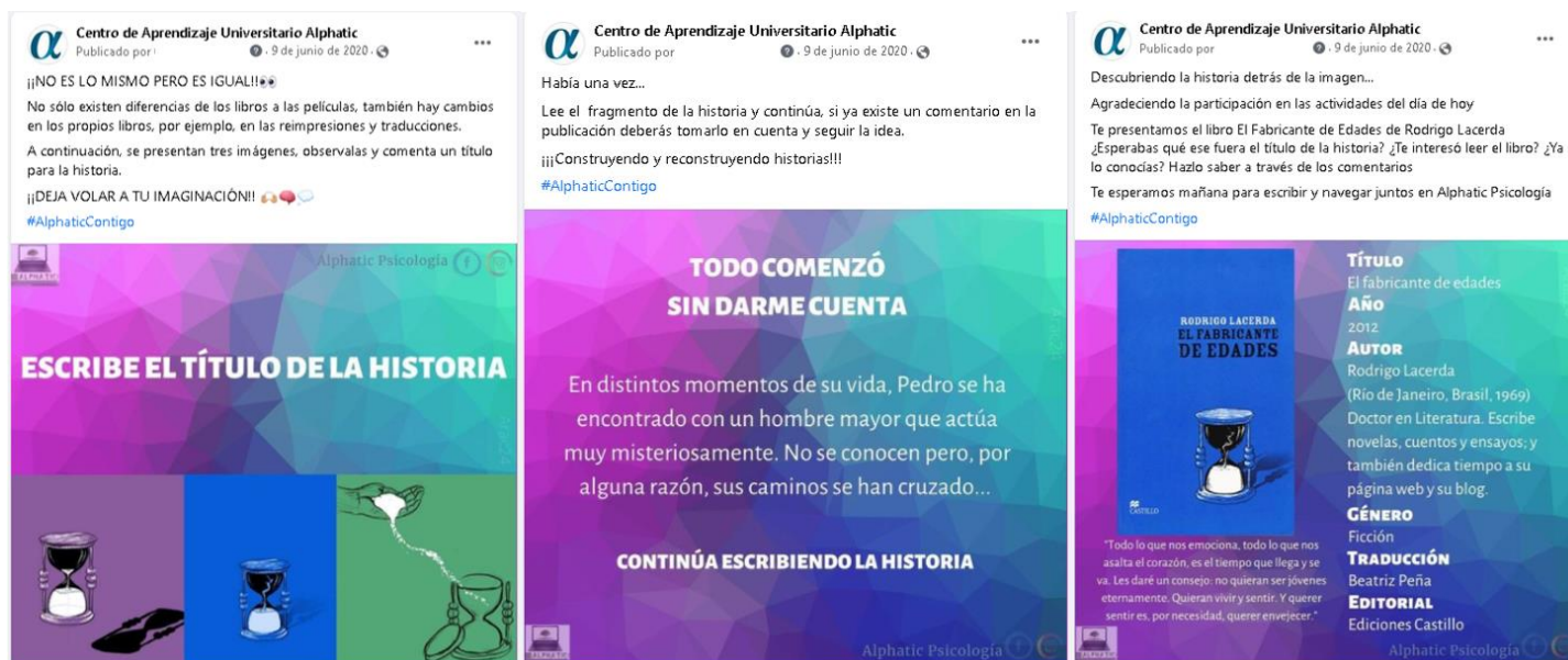
Figura 1. No es lo mismo, pero es igual, la historia detrás de la imagen.

Considerando la perspectiva de Cassany (2010) que refiere a leer la ideología, al tiempo de conformar la propia, la actividad No es lo mismo, pero es igual se organizó en tres momentos diferentes. El primero con un recurso en el que se integran tres versiones de portada de un mismo texto, invitando a proponer un título para las imágenes (Figura 1). Enseguida , se enlaza la publicación de un material gráfico solo con texto, éste refiere al inicio de la historia del libro seleccionado y con la cual se invita a crear la continuación de la historia, situando la participación como continuidad de participaciones anteriores (Figura 1). Finalmente, se realizó una tercera publicación que corresponde a la presentación del libro, al que aludían las publicaciones anteriores, invitando a reflexionar y participar sobre las anticipaciones realizadas, así como el interés por la historia (Figura 1).