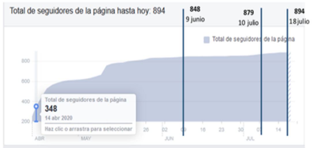
Figura 5. Adscripción de usuarios a miembros