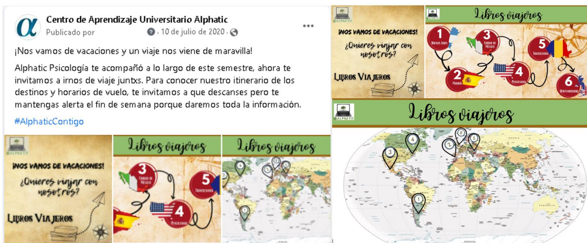
Figura 3. Nos vamos de vacaciones, libros viajeros

Es entonces que, se elaboraron materiales visuales con los que el seguidor de la página decide su destino de viaje, brindando información sobre cómo acceder al viaje y sus opciones para tomar una decisión, así se utiliza la analogía de una agencia de viaje para generar una reflexión y planeación por parte del seguidor. Siendo así, la primera publicación se acompaña de tres materiales, uno de presentación de la actividad, otro acompañado de un mapamundi que señala los países destino, considerando la ciudad natal de cada autor y, finalmente, se mostraba la ruta que se iba a tomar a lo largo de la semana (Figura 3). Cabe mencionar que, la actividad se diseña a partir de reconocer el análisis que realiza Cassany (2010) para exponer la práctica social de literacidad mediante los hechos de escritura que acompañan las interacciones de las personas en un contexto de aeropuerto.