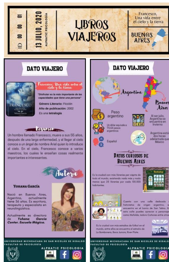
Figura 4. Ejemplo de las infografías para los destinos.

estación del año en la que se encuentra y la diferencia horaria entre México (país de salida) con el país destino y, finalmente, se agregó información del país (Figura 4).