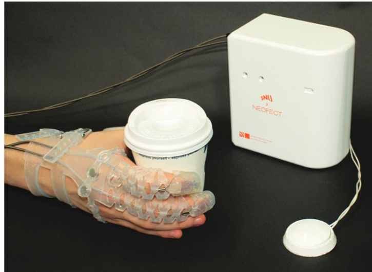
Figura 2. Exo Glove Poly II con accionamiento por cable.

Kang, B. B., Choi, H., Lee, H., & Cho, K.-J. (2019). Exo-Glove Poly II: A Polymer-Based Soft Wearable Robot for the Hand with a Tendon-Driven Actuation System. Soft Robotics , 6(2), 214–227. https://doi.org/10.1089/soro.2018.0006