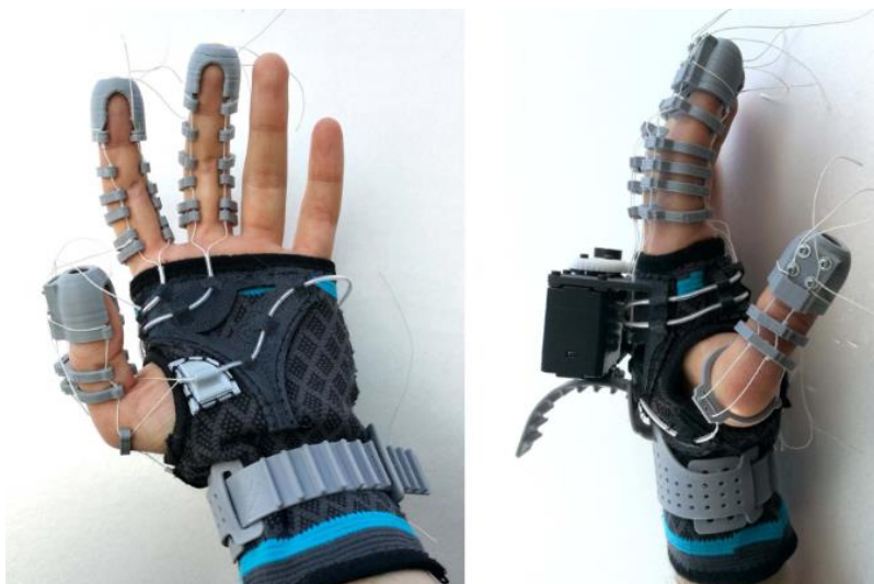
Figura 4. Guante robótico accionado por cable y validado con FEM.

Bagneschi, T., Chiaradia, D., Righi, G., Popolo, G. D., Frisoli, A., & Leonardis, D. (2023). A Soft Hand Exoskeleton With a Novel Tendon Layout to Improve Stable Wearing in Grasping Assistance. IEEE Transactions on Haptics , 16(2), 311–321. https://doi.org/10.1109/TOH.2023.3273908