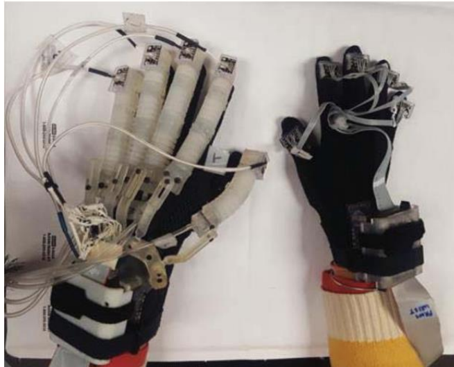
Figura 5. Guante robótico bilateral para terapia espejo

Haghshenas-Jaryani, M., Pande, C., & Muthu Wijesundara, B. J. (2019). Soft Robotic Bilateral Hand Rehabilitation System for Fine Motor Learning. 2019 IEEE 16th International Conference on Rehabilitation Robotics (ICORR), 337–342. https://doi.org/10.1109/ICORR.2019.8779510