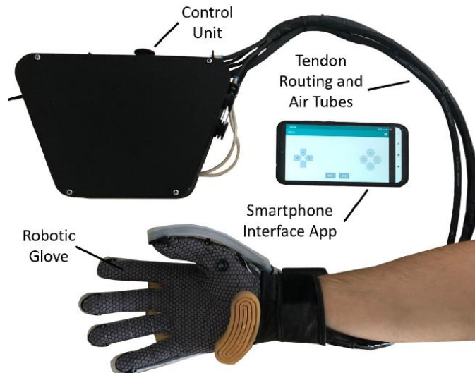
Figura 3. Guante robótico con capacidad de abducción en cada dedo.

Gerez, Lucas; Gao, Geng; Dwivedi, Anany; Liarokapis, Minas . (2020). A Hybrid, Wearable Exoskeleton Glove Equipped With Variable Stiffness Joints, Abduction Capabilities, and a Telescopic Thumb. IEEE Access, 8(), 173345–173358. doi:10.1109/ACCESS.2020.3025273