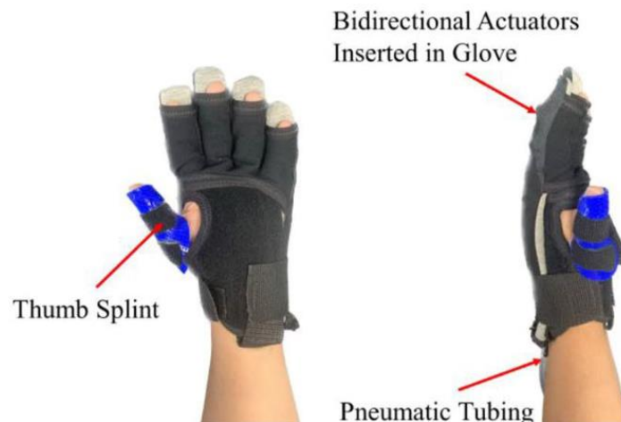
Figura 1. Guante robótico, SR Glove, con accionamiento neumático

Lim, D. Y.-L., Lai, H.-S., & Yeow, R. C.-H. (2023). A bidirectional fabric-based soft robotic glove for hand function assistance in patients with chronic stroke. Journal of NeuroEngineering and Rehabilitation , 20(1), 120. https://doi.org/10.1186/s12984-023-01250-4