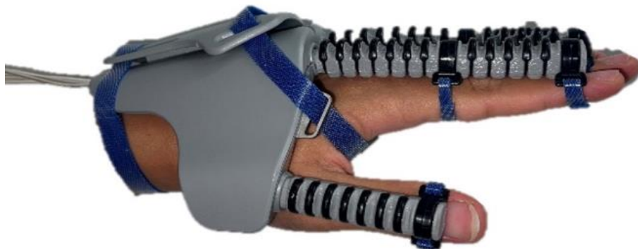
Figura 7. Guante robótico que trabajar a partir de señales EEG

Zhou, C.-Q., Shi, X., Li, Z., & Tong, R. K.-Y. (2022). 3D Printed Soft Robotic Hand Combining Post-Stroke Rehabilitation and Stiffness Evaluation (pp. 13–23). https://doi.org/10.1007/978-3-031-13835-5_2